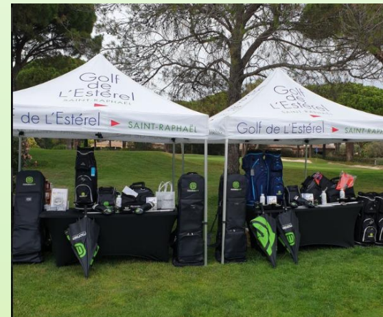
Conséquente remise de prix