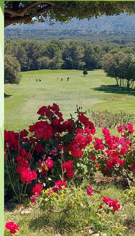
Golf de Saumane